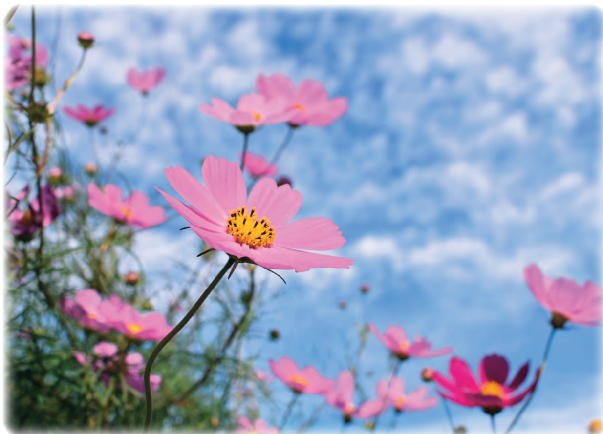
秋空と秋桜